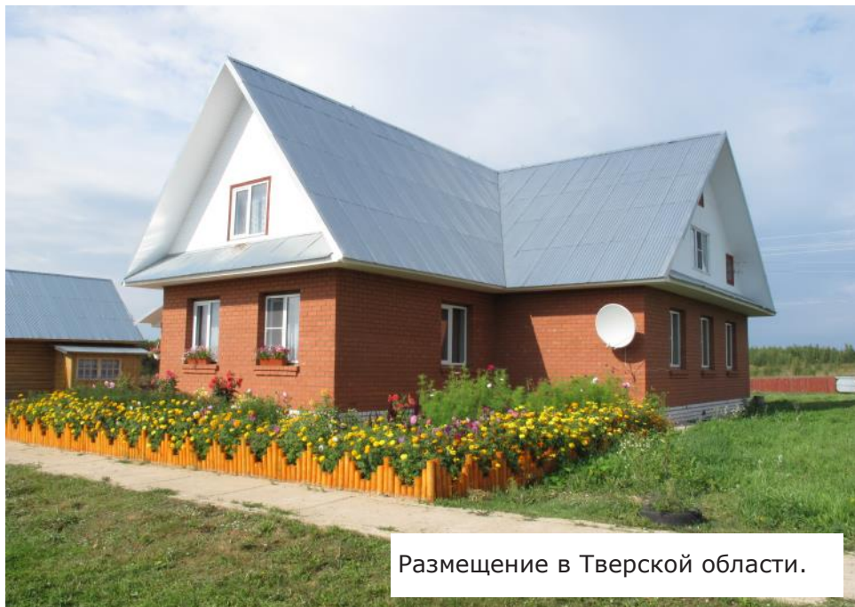
Размещение в Тверской области.